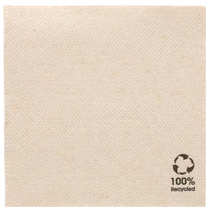
SERVILLETAS DE PAPEL NATURAE 200X200 MM. CAJA 3000 UDS.