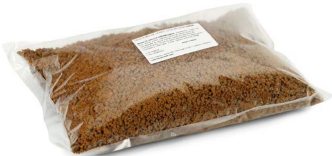
GALLETA LOTUS TROCITOS 2 / 75 KG.