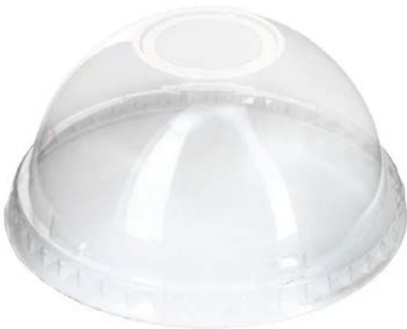
TAPAS CON CÚPULA PARA VASOS