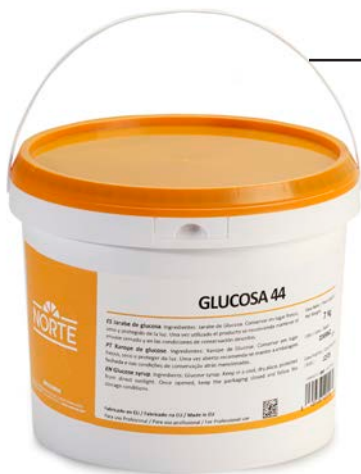
GLUCOSA 44 NORTE 7 KG.