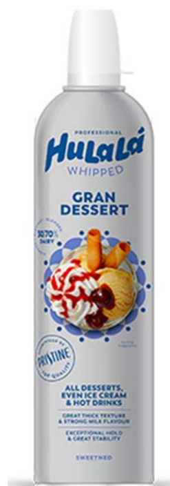
NATA SPRAY HULALA GRAN DESSERT ARCONSA 700 ML.