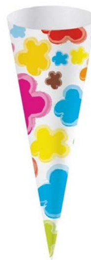
FUNDA EN PAPEL PARA CONOS CAJA 200 UDS.

capacidades: 235 cc. 280cc. 320 CC. 370 CC.