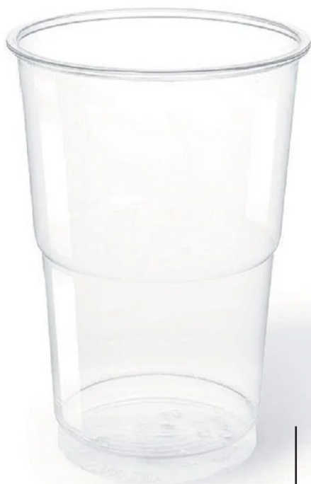
VASOS PLÁSTICO REUTILIZABLE

capacidades: 275 cc. 375 cc. 525 cc. 600 cc.