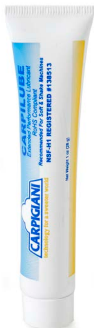
SILICONA ALIMENTARIA GRANIZADORA