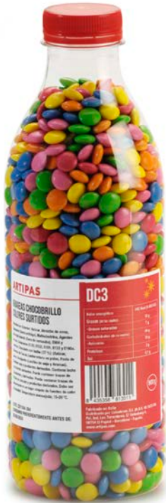
BOTONES CHOCOLATE SURTIDOS ARTIPAS 1KG.