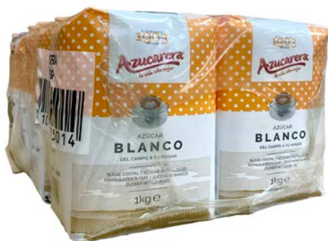
AZÚCAR EN GRANO AZUCARERA 1HG.