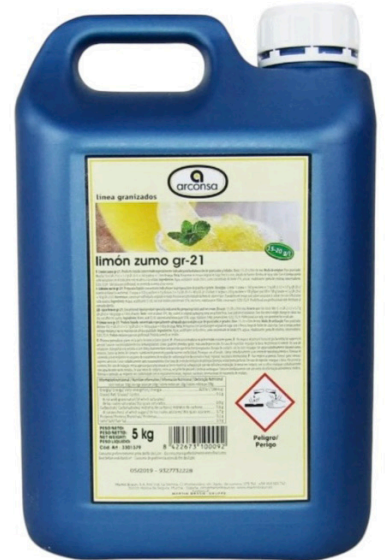
EXTRACTO DE LIMON GR-21 ARCONSA 5 LTJ.