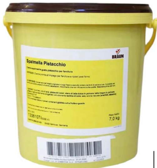
CREMA SPALMELLA PISTACHO BRAUN 7 HG.