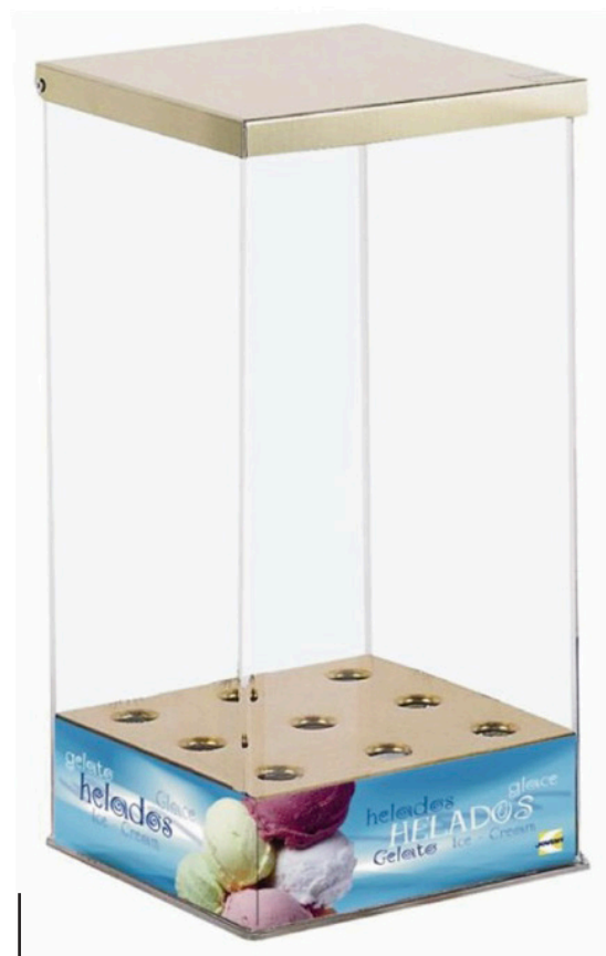
VITRINA PARA BARQUILLOS 20X20X40