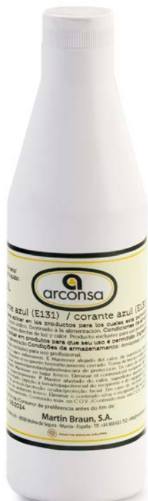
COLORANTE LIQUIDO ARCONSA 200 ML.

SABORES: rojo verde azul amarillo otros.