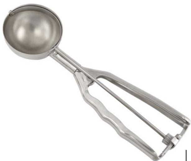
CUCHARA AUTOMÁTICA HELADERÍA