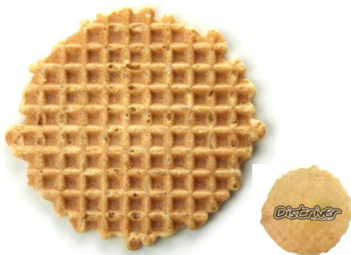
GALLETA DISCO CARAMELIZADA CAJA 1000 UDS. PERSONALIZABLES