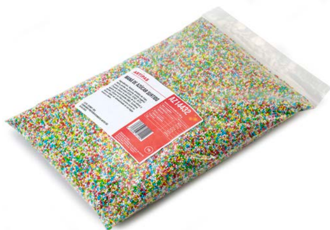
MANÁ DE AZÚCAR DE COLORES ARTIPAS 1 KG.