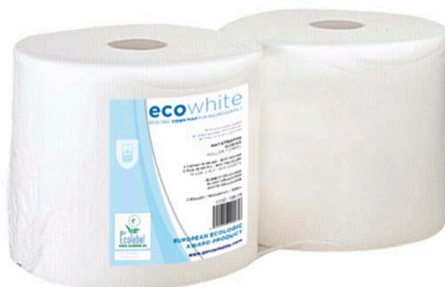
BOBINAS PAPEL SECAMANOS DOS CARAS BOBINA 3 KG.