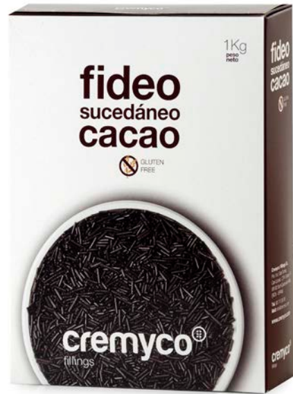
FIDEO DE CHOCOLATE CREMYCO 1KG.