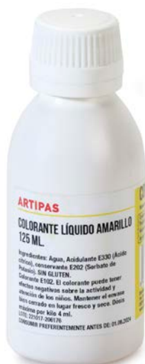
COLORANTE LIQUIDO ARTIPAS 1KG.

SABORES: rojo verde azul amarillo negro marrón otros.