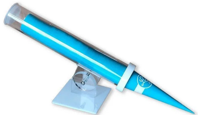
DISPENSADO PARA CONOS DE PAPEL