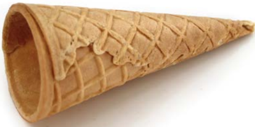
MINI CONO BARQUILLO 60 MM CAJA 920 UDS.