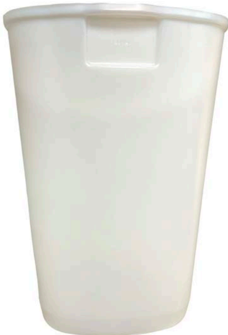
DEPÓSITO PARA GRANIZADO 20 L.