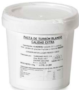
PASTA DE TURRÓN BLANDO JIJONA CALIDAD EXTRA 5KG.