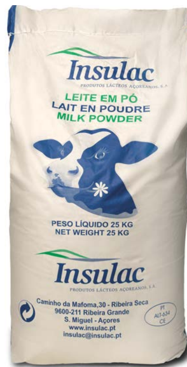
LECHE EN POLVO 26% INSULAC 25 KG.

*Consultar con nuestro equipo comencia otros sabores disponibles.