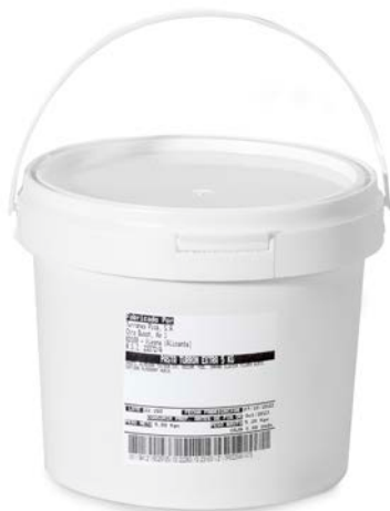
TURRÓN EN GRÁNULO JIJONA CALIDAD EXTRA 5 KG.