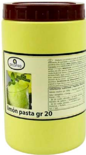
LIMON PASTA GR-20 ARCONSA BOTE 1,5 KG.