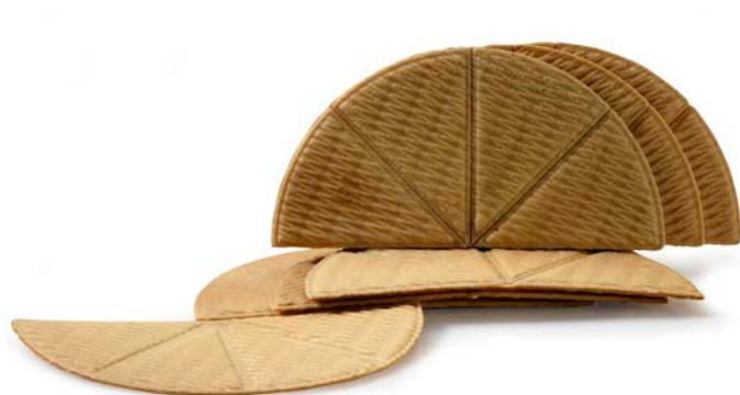
ABANICO ARTESANO CAJA 60 UDS.