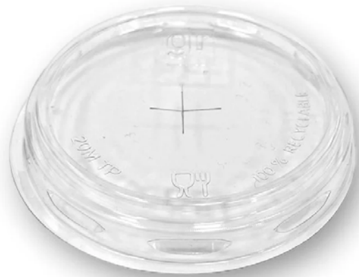
TAPAS PARA VASOS CON AGUJERO