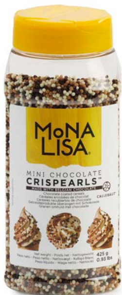
CRISPEARLS BAÑADOS EN CHOCOLATE MONA LISA 800 GR.