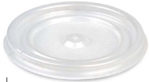
TAPAS PARA VASOS