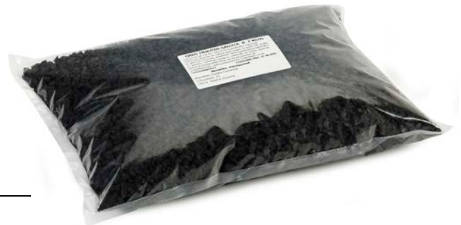
GALLETA OREO TROCITOS 400 GR.