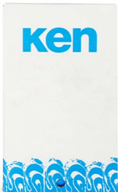
KEN HELADO SOFT KEN 10 KG.