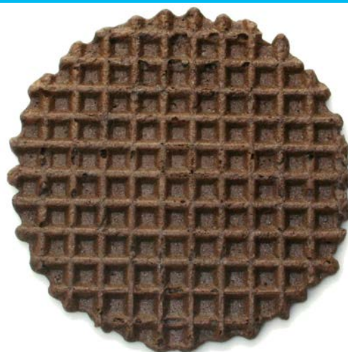
GALLETA DISCO CHOCOLATE CAJA 1000 UDS.