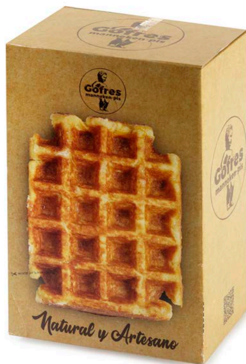
GOFRE COCIDO MANNEKEN PIS CAJA 24 UDS.