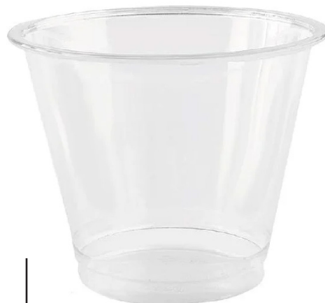
VASOS PLÁSTICO REUTILIZABLE

capacidades: 275 cc. 375 cc. 525 cc. 600 cc.