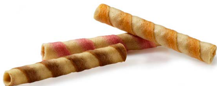
CUBANITOS BICOLOR BOTE 250 UDS.