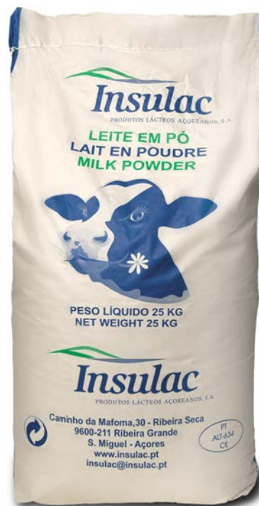
LECHE EN POLVO 10% INSULAC 25 KG.

*Consultar con nuestro equipo comencia otros sabores disponibles.