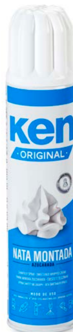
NATA SPRAY UHT 35% KEN 500 GRM.