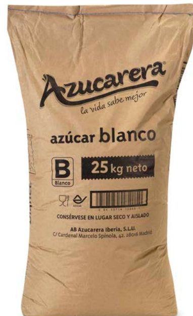
AZÚCAR EN GRANO AZUCARERA 25 HG.