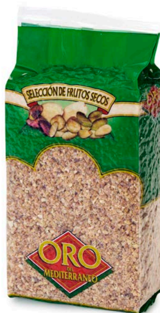
ALMENDRA CROCANTE ORO DEL MEDITERRÁNEO 1 KG.