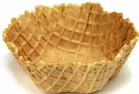
TULIPA BARQUILLO ARTESANA tamaños: diferentes disponibles