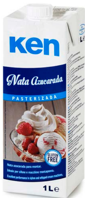
NATA AZUCARADA KEN 1 LT.