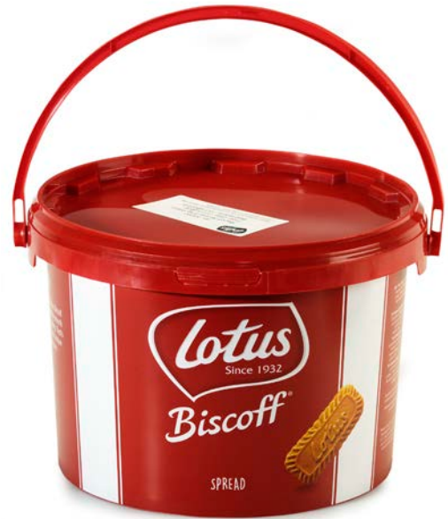
CREMA DE GALLETA LOTUS BISCOFF LOTUS 1,6 / 8 HG.