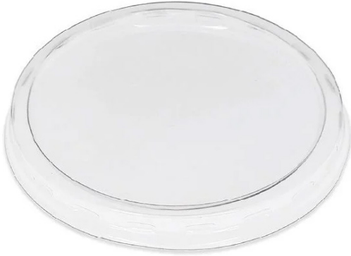
TAPAS PARA TARRINAS CAJA 100 UDS.