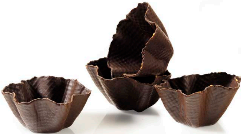
TULIPA BAÑDA EN CHOCOLATE tamaños: diferentes disponibles