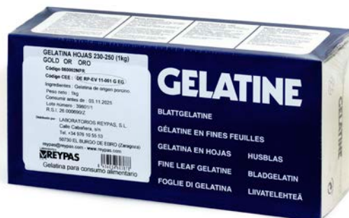
GELATINA EN HOJAS ORO REYPAS Bloom 230/250