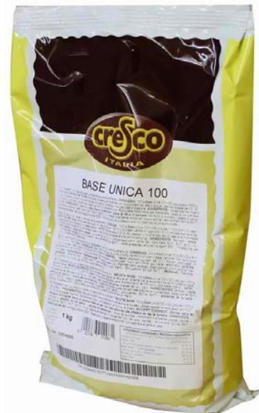
BASES UNIVERSALES PARA HELADO Y CREAMAS DE FRUTAS CRESCO 1 HG.

*Consultar con nuestro equipo comercial otros modelos disponibles.