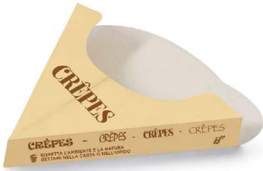
PORTA GOFRES CARTÓN 500 UDS.