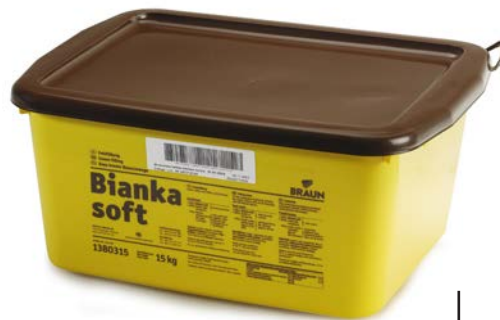
CREMA BASE BIANKA SOFT BRAUN 15 HG.