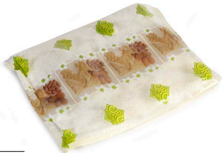
COCO RALLADO ORO DEL MEDITERRÁNEO 1 KG.