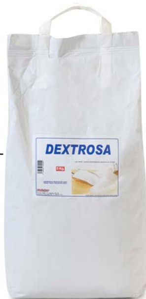
DEXTROSA 4 / 25 KG.