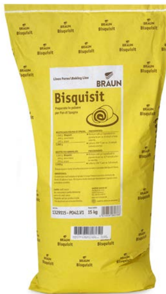
PREPARADO PARA BIZCOCHO BISQUISIT BRAUN 15 HG.