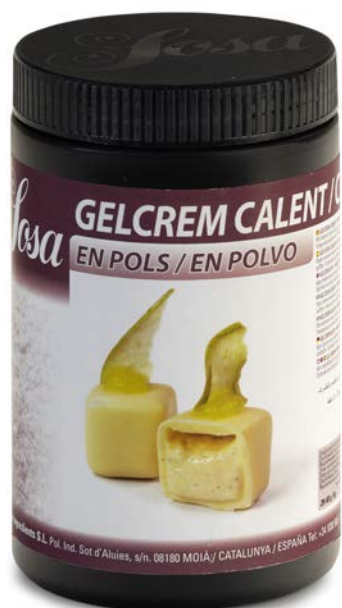
GELCREM CALIENTE SOSA Ud. 500 GR.