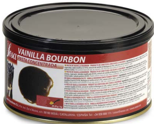
PASTA DE VAINILLA BOURBÓN SOSA Ud. 1,5 HG.