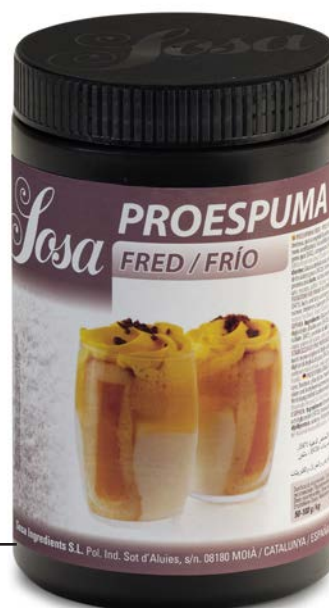
PROESPUMA EN FRIO SOSA Ud. 500 GR.