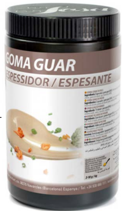
GOMA GUAR SOSA UD. 750 GR.