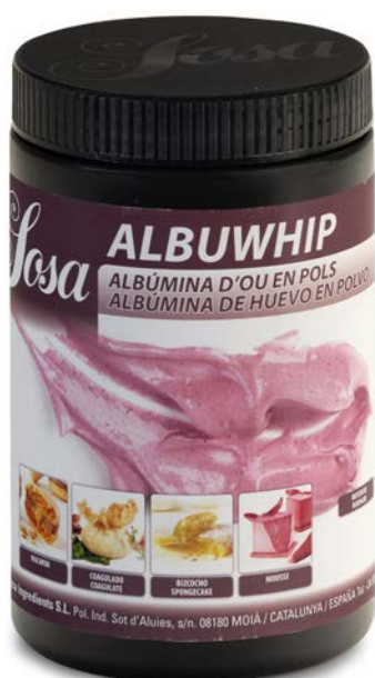
ALBUWHIP CLARA DE HUEVO EN POLVO SOSA Ud 500 GR.