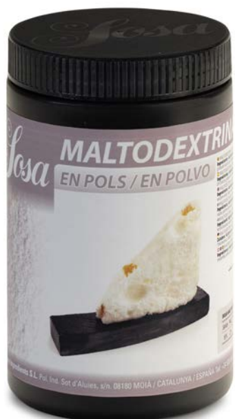
MALTODEXTRINA SOSA Ud 500 GR.