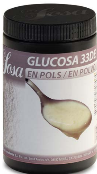
GLUCOSA EN POLVO SOSA Ud 500 GR.