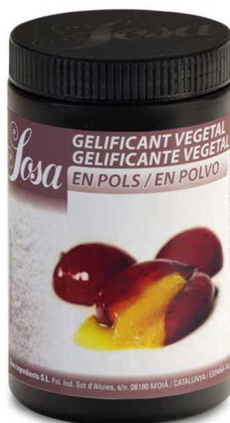
GELIFICANTE VEGETAL EN POLVO SOSA Ud. 500 GR.