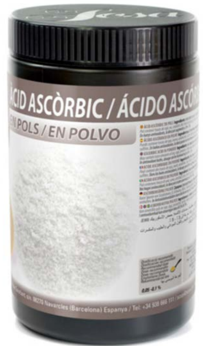
ACIDO ASCORBICO SOSA UD. 1 HG. —