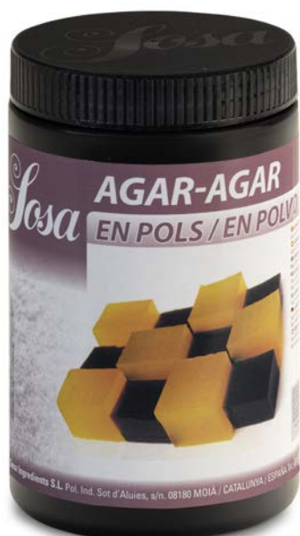
AGAR-AGAR SOSA Ud. 500 GR.