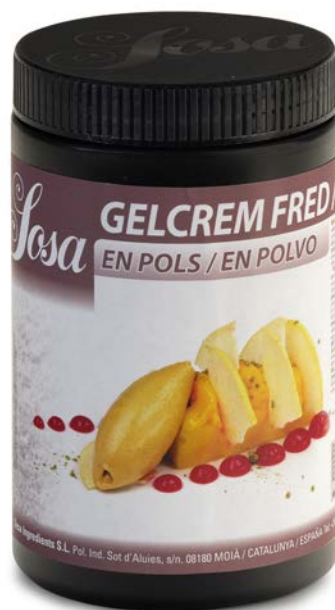
GELCREM FRIO SOSA Ud. 500 GR.