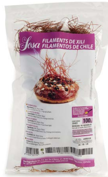
FILAMENTOS DE CHILE SOSA Ud. 100 GR.