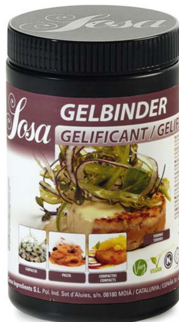
GELBURGUER (GELBINDER) SOSA Ud. 500 GR.