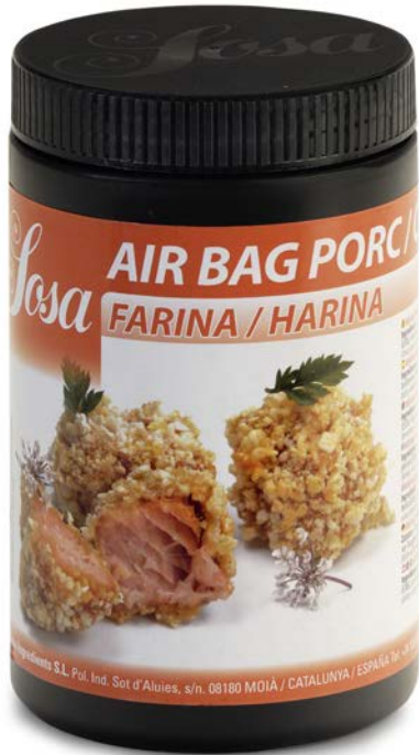
AIR BAG (VARIOS) SOSA Ud -