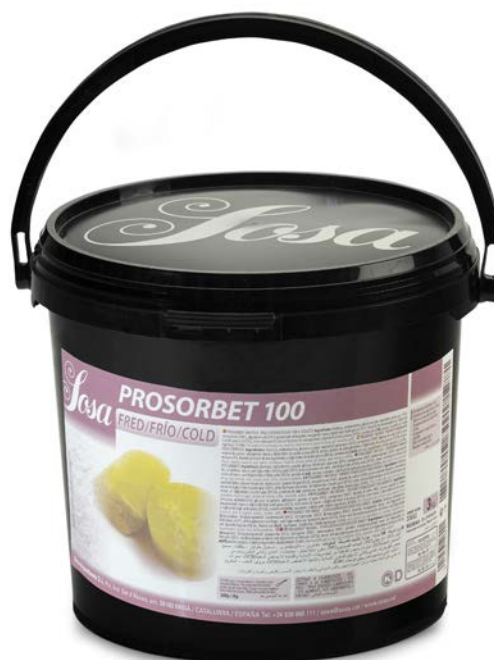
PROSORBET 100 FRIO SOSA Ud. 3 HG.