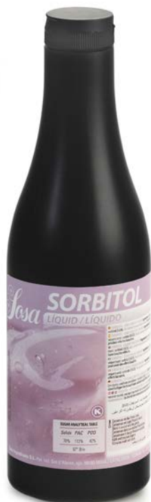
SORBITOL LÍQUIDO SOSA Ud 1,3 HG.