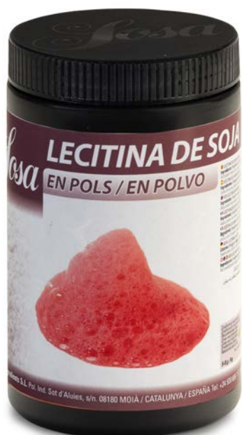
LECITINA DE SOJA EN POLVO SOSA Ud. 500 GR.