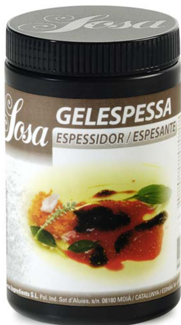
GELESPESSA (XANTANA) SOSA Ud 500 GR.