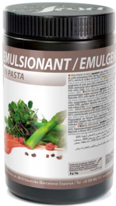
EMULSIONANTE EN PASTA SOSA Ud 1 KG.